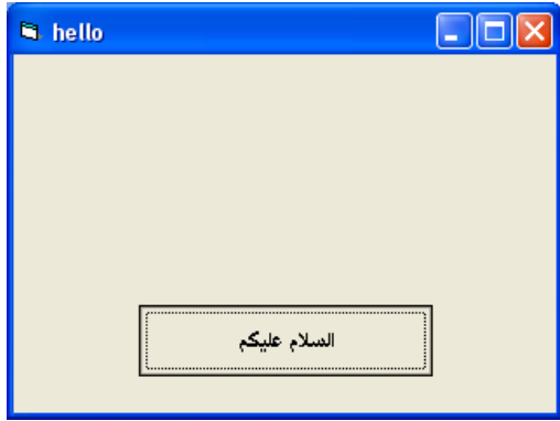
بعد الضغط علي الزر

قم بتشغيل البرنامج وقم بالضغط علي الزر وانظر ماذا تلاحظ ؟؟؟؟؟؟؟؟؟