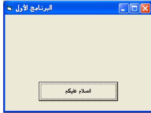
قبل الضغط علي الزر